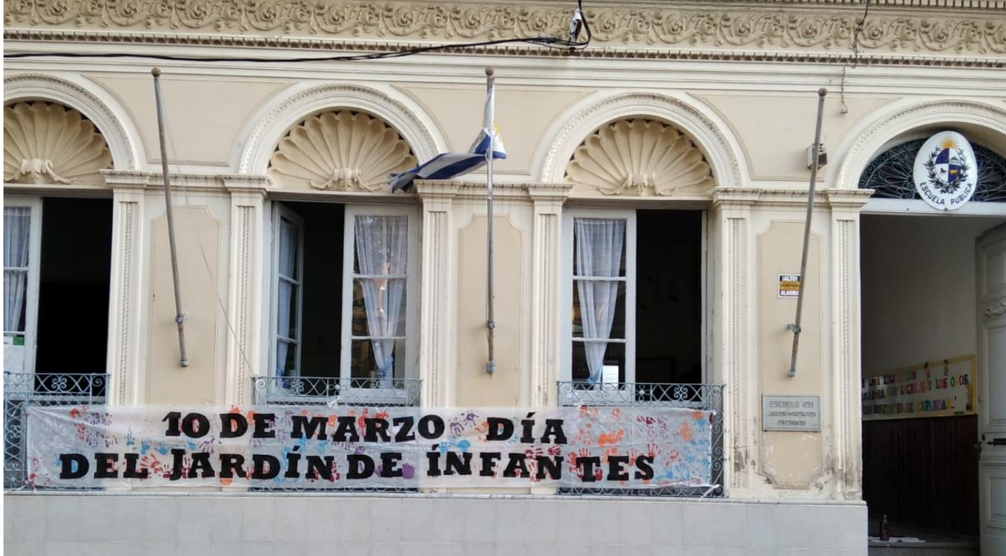
JARDIN DE INFANTES N° 91 ENRIQUETA COMPTE Y RIQUE PAYSANDÚ