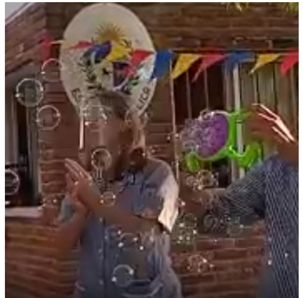
JARDIN DE INFANTES JORNADA COMPLETA N° 103 PAYSANDÚ