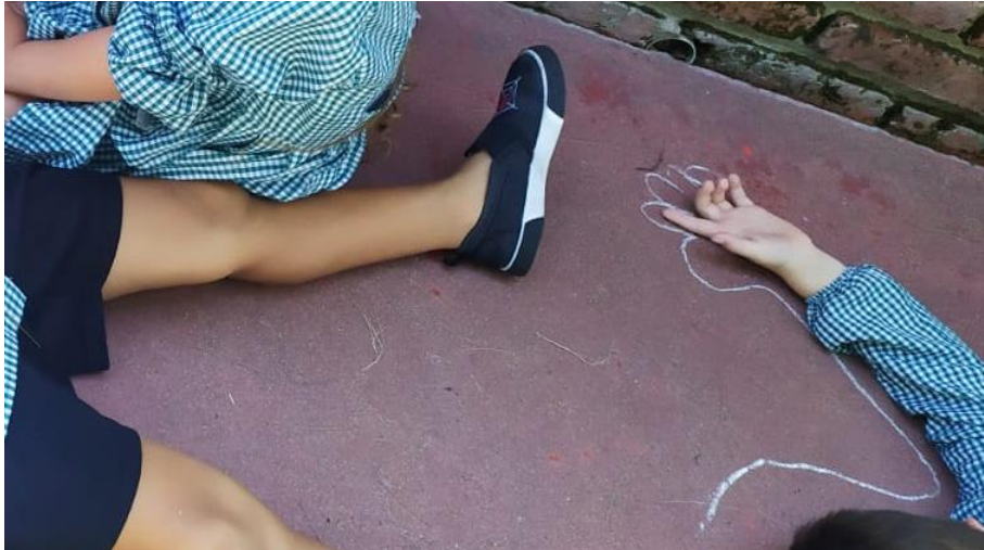
JUEGOS AL AIRE LIBRE- QUEBRACHO- PAYSANDÚ