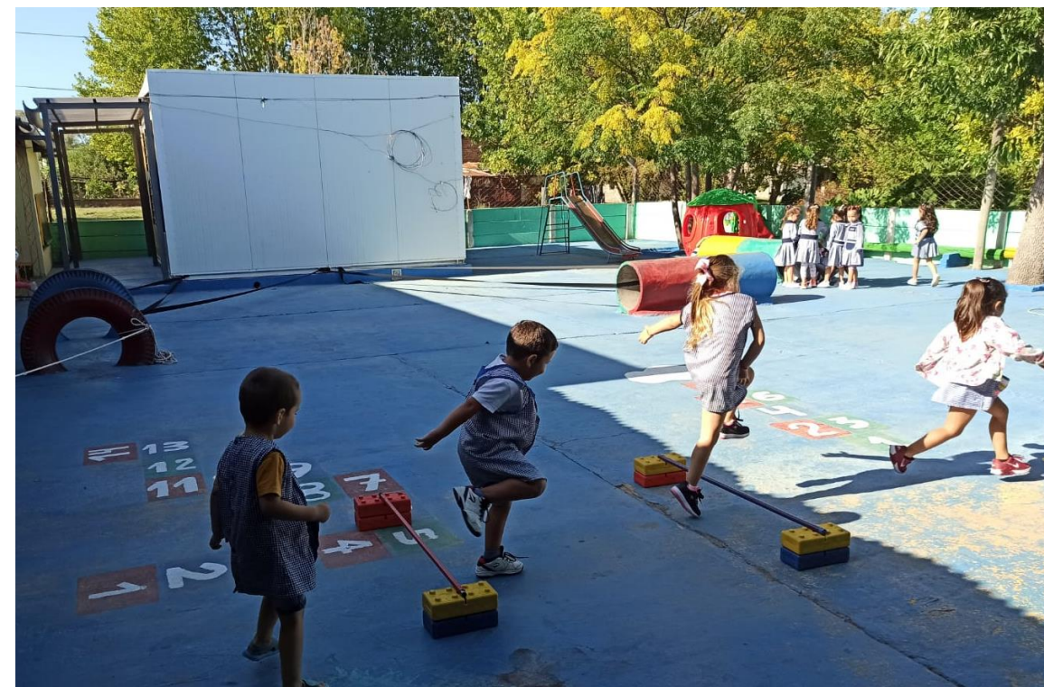
JARDIN DE INFANTES N° 104 - GUICHON- PAYSANDÚ