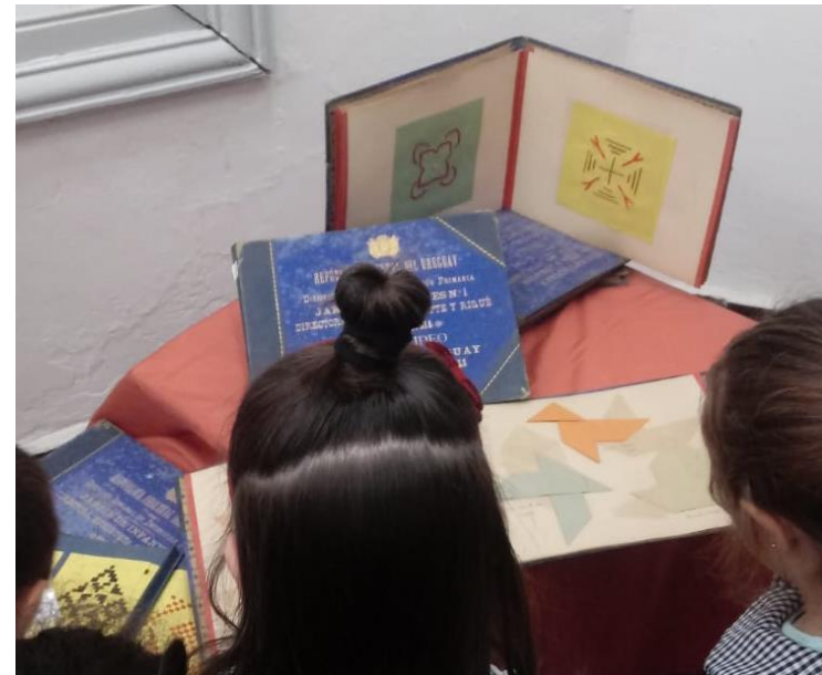
JARDÍN DE INFANTES N° 213 ENRIQUETA COMPTE Y RIQUE MONTEVIDEO